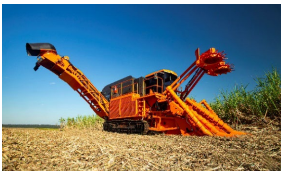
图 5

JACTO 生产各类种植、施肥、喷洒和收割机械，是南美最大的农业机械制造商之一。